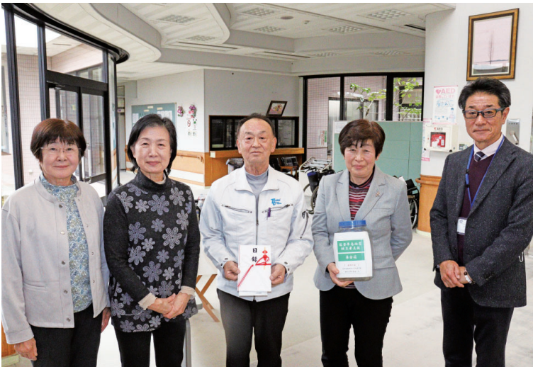
稲敷市江戸崎中学校昭和 44 年卒業生一同「若竹の会」

令和 6 年能登半島地震義援金を 1 月 4 日から開始し、義援金として多くの皆様よりご厚志を賜りました。引き続き令和 6 年 6 月 28 日（金）まで義援金の受け付けをしておりますのでご協力をお願いします。